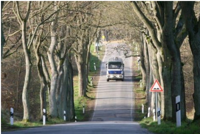
Abbildung: Die L11 hinter Suckwitz Richtung Reimershagen

RREP MM, G (10) „Die überregionalen Radwanderwege und Wanderwege sollen...die Zentren des Fremdenverkehrs sowie die attraktivsten Landschaftsräume unmittelbar erschließen. Das touristische Wegenetz soll bei allen Planungen und Maßnahmen berücksichtigt werden.“